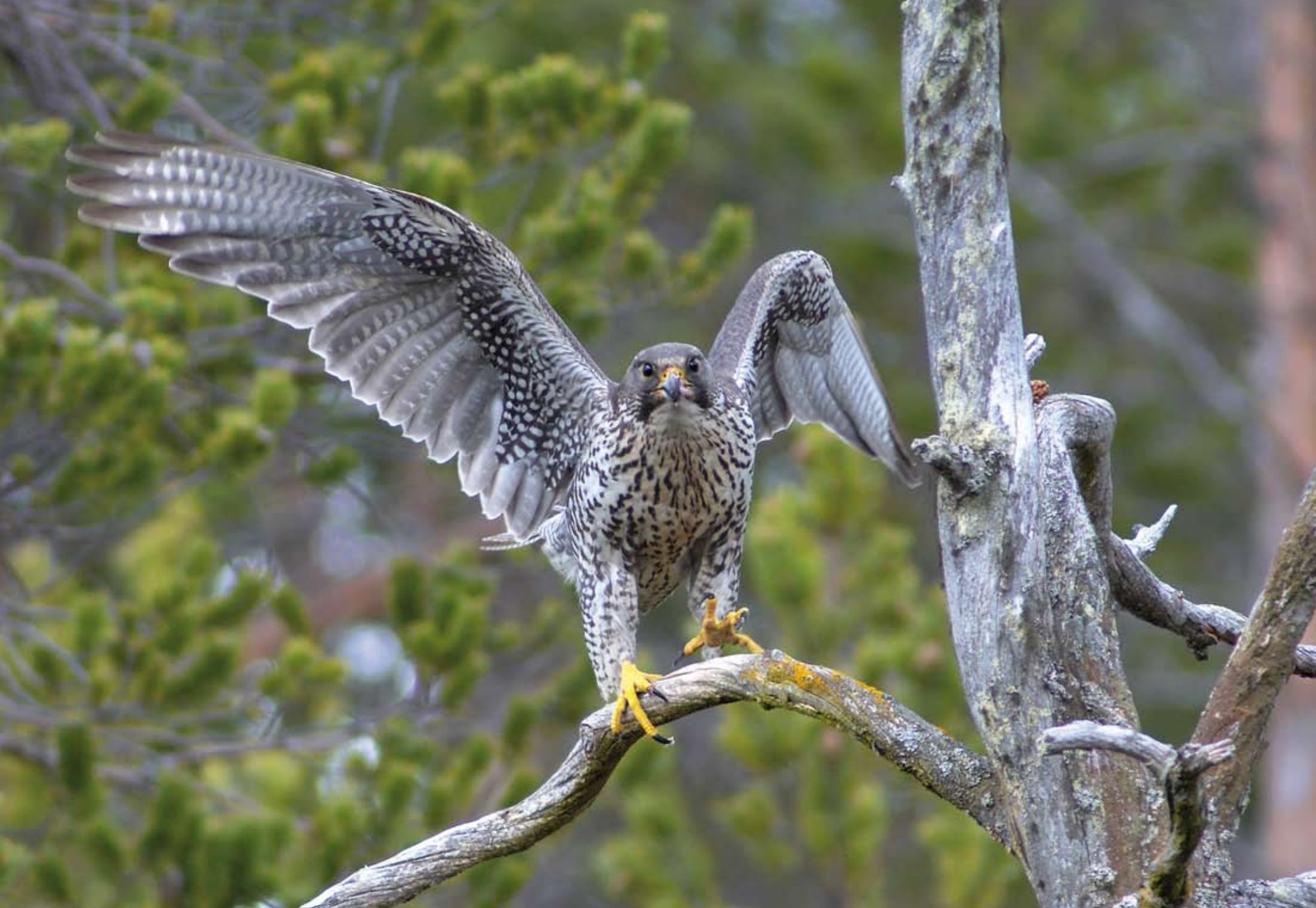
Voksen jaktfalk.