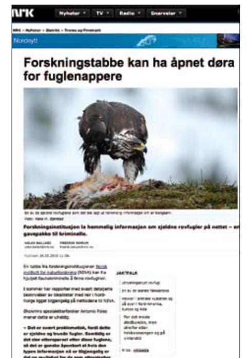
Faksimile fra NRK Troms og Finnmarks nettsider 26. august 2010.